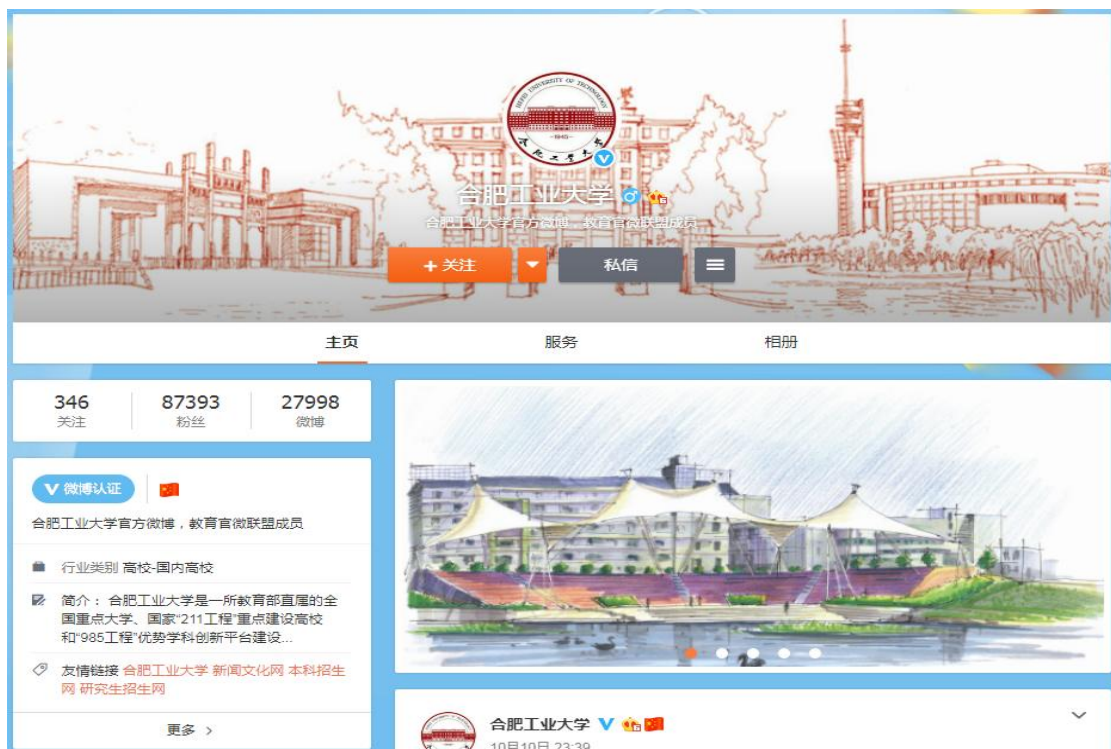
图 1：学校官方微博页面

学校信息公开网包括信息公开指南、信息公开目录、规章制度、依申请公开、受理与监督、信息查询等多个栏目。通过网站内容和相关链接，学校师生和社会公众可以对学校信息公开的制度及内容进行高效和便捷的查阅查询。为适应现代科技的快速发展和扩展师生员工、社会公众获取消息的渠道，学校构建了以学校主页为基础，新闻文化网为主要载体，结合微博、微信等新媒体的全新综合信息发布渠道，推动信息公开工作深入开展。