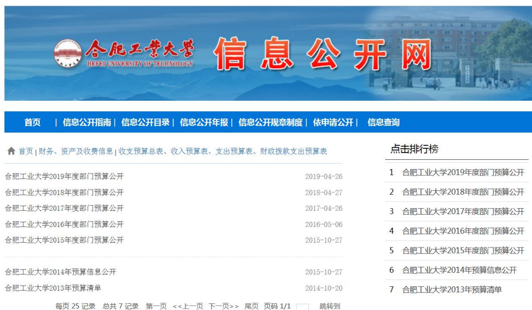
图 7：学校年度部门预算公开情况

教代会上，由分管财务部门的校领导向大会汇报当年学校的财务收支状况；通过校情通报会、校财经工作领导小组会等形式，通报财务运行状况和各单位预算执行情况。在教育部预算、决算批复后 10 个工作日内，通过学校信息公开网及时主动地向社会主动公开高等学校收支预算总表、高等学校收入预算表、高等学校支出预算表、高等学校财政拨款支出预算表、高等学校收支决算总表、高等学校收入决算表、高等学校支出决算表、高等学校财政拨款支出决算表等财务信息。