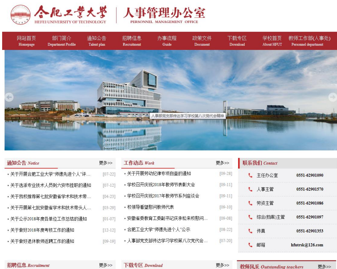
图 8：学校人事师资信息公开情况

员管理办法》，致力于培养高层次创新型青年人才，提升学科建设水平。学校中层干部任免调整，按程序公布相关信息，发布任前公示。公开招聘人员公示情况也在人事部网站予以公开。