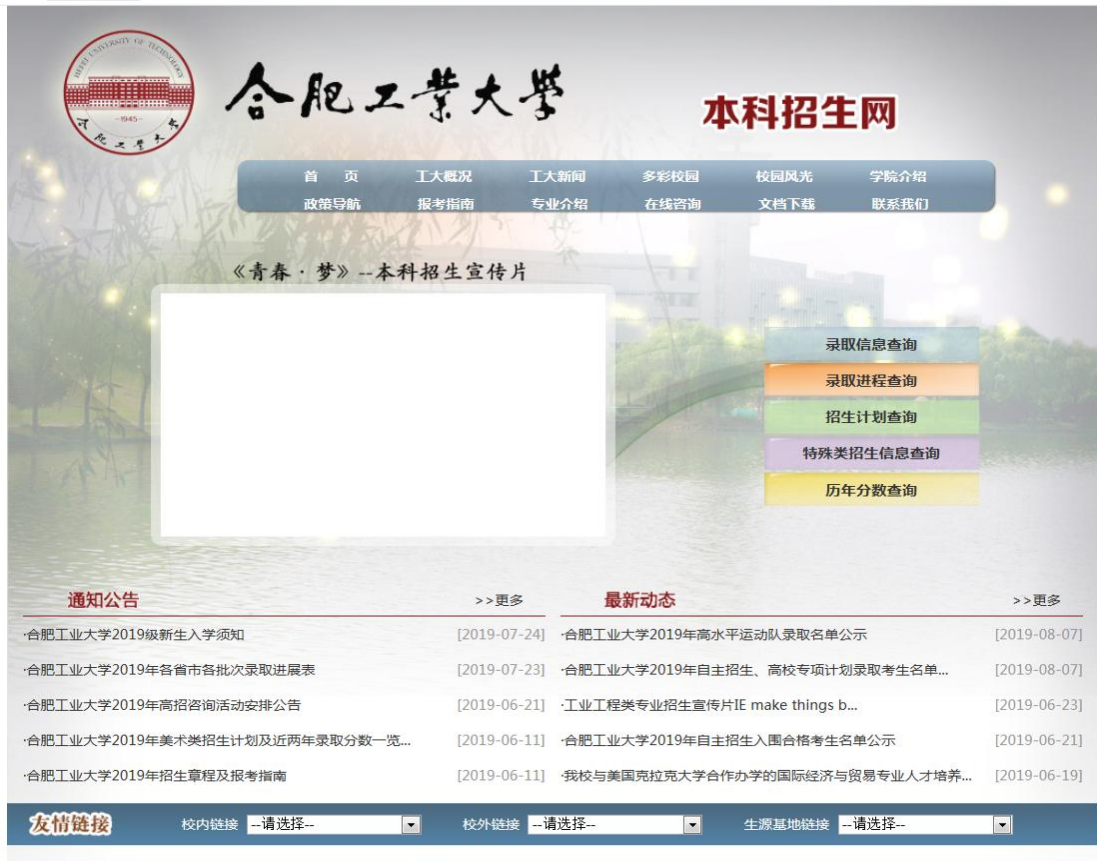
图 5: 合肥工业大学本科生招生网站

拟定各专业研究生招生计划，发布招生简章，及时更新教育部关于全国硕士研究生招生工作管理规定的通知，制定合肥工业大学研究生招生复试实施办法和硕博连读生遴选实施办法，对考试内容、考试方式、报考点情况进行网上公示，并设有咨询热线，由专业分管老师负责解答。对研究生报名、资格审查、录取结果公示、考生调剂等流程严格把关，并及时公布招生计划的动态变化，做到招生录取信息全面公开。