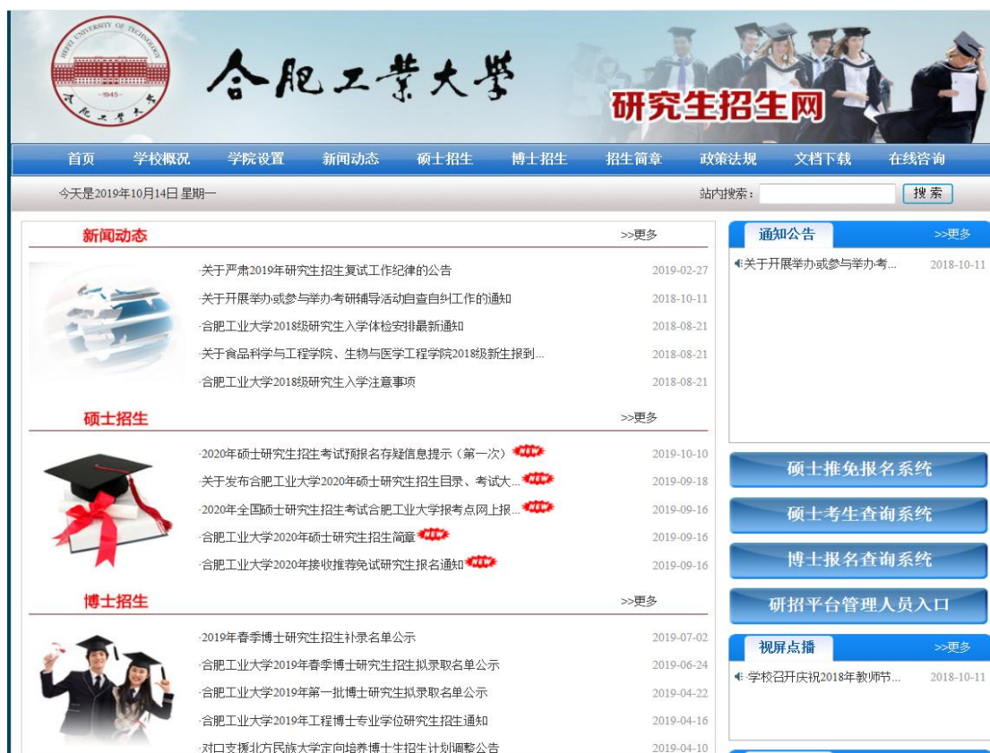
图 6: 合肥工业大学研究生招生网站