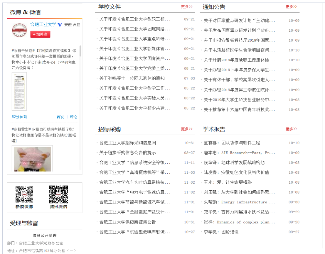
图 2：学校信息公开网主页