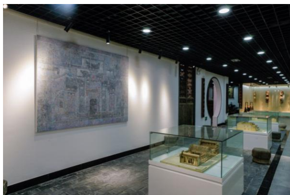
图 5：徽派建筑文化展示中心