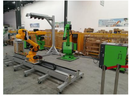
图 4：机器人智能喷涂柔性生产线系统