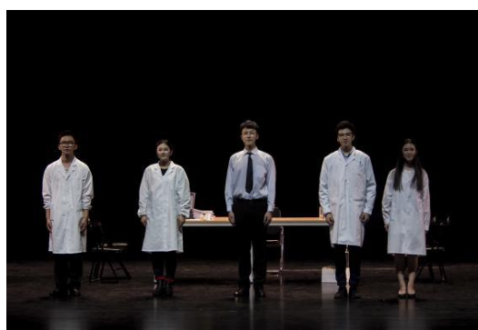
图 6：舞台剧《我的教授爸爸》

将大学生艺术团以独立运行中心的模式纳入共青团“一心双环”组织格局，充分发挥大学生艺术团在大学生美育工作中的领头雁作用，从而营造有利于大学生思想道德和文化素质提升的育人环境。2018年，学校精心打造了舞台剧《我的教授爸爸》，该剧以合肥工业大学已故教授费业泰为原型，刻画了父子亲情、师生之情以及老一代科研工作者鞠躬尽瘁、无怨无悔的奉献精神，向广大青年学子传递不忘初心，牢记使命，勇担大任的价值追求，该作品荣获全国第五届大学生艺术展演活动艺术表演类二等奖，并已通过教育“高校原创文化精品推广行动计划”资格审核，进入遴选环节；同时汉唐舞《水墨徽州》、现代舞《毕业照》、现代舞《不能忘却的记忆》，合唱《我祝福你森林》、《桃花红杏花白》、《让世界都赞美你》，萨克斯重奏《半个月亮爬上来》等优秀作品先后获奖，在各类演出中广受赞誉。