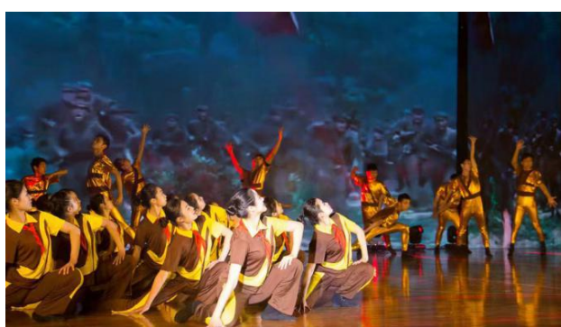
图 7：现代舞《不能忘却的记忆》