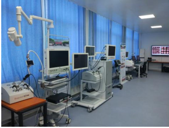
图 1：移动装备制造平台