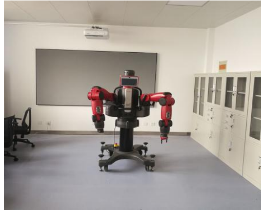
图 2：智能制造自动化控制集成系统与平台