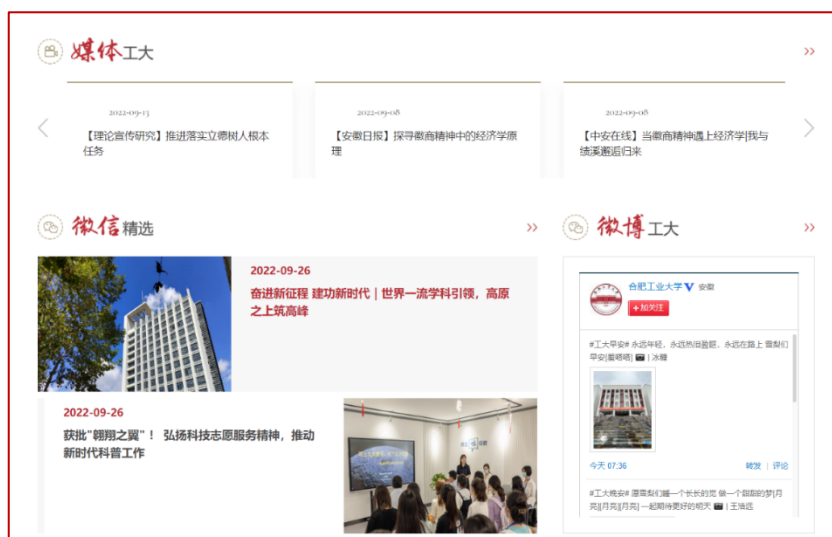
图 3：合肥工业大学“媒体工大”“微信精选”“微博工大”栏目

合肥工业大学信息公开工作旨在为实现学校奋斗目标，完善现代大学制度，促进依法治校、科学发展而服务。基本信息栏目内容主要包括学校简介，校级领导班子简介及分工，学校机构设置，学校章程及制定的各项规章制度，教职工代表大会相关制度、工作报告，学术委员会相关制度、年度报告，学校发展规划、年度工作计划及重点工作安排，信息公开年度报告等。