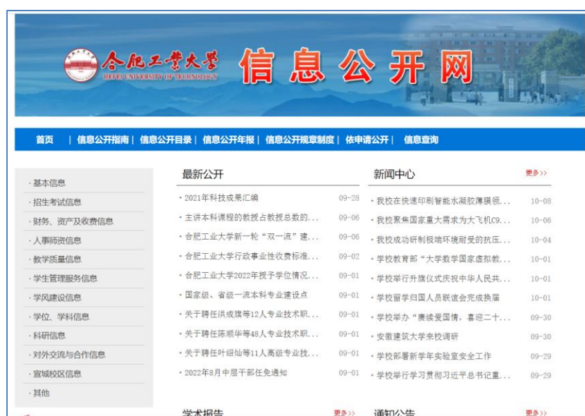
图 1：学校信息公开网主页

同用户的实际需求，精准化、有针对性地推送信息。另一方面巩固拓展线下渠道的亲沟通和作用。通过教代会、工代会、理事会、校情通报会、工作研讨会、民主党派与统战团体座谈会、校领导接待日、学生午餐会等渠道与师生保持常态化的沟通，使信息输出、部署动员、解疑答惑与倾听一线声音、了解师生诉求相结合。