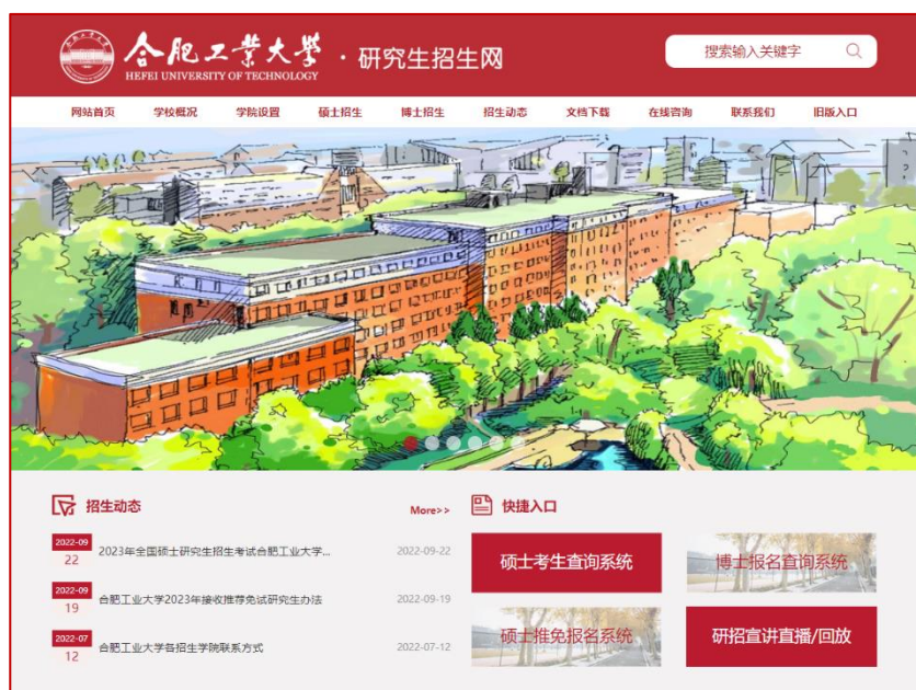
图 6：合肥工业大学研究生招生网站

充分运用新媒体，适应新时代考生特点。首次开展网络宣讲，组织 18 个招生单位通过网络直播平台进行线上招生宣讲并在线答疑，直播累计观看人次超过 20 万，让广大考生对学校各学院学科和人才培养优势做了深入理解。充分利用研招办微信公众号，宣传学校研招相关政策办法，搭建与考生互动平台，公众号关注人数达 4.2 万人，一年来累计推送招生相关文章 30 余篇。安排全部招生单位研究生招生相关工作人员入驻考研分答系统，点对点回复考生提问。指导相关学院组织开展优秀大学生暑期学校（含线上夏令营）和推免生预报名，有效吸引了部分优质生源，2021 年接收推免生 257 人，较 2020 年增长 39.67%。