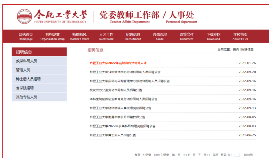
图 7：学校人事招聘网站