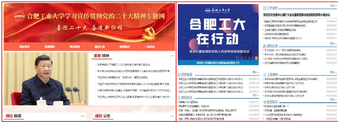
图 4：“学习贯彻党的二十大精神专题网” “新型肺炎防控专题网” 专题版块